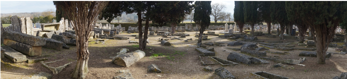
Vue partielle de la nécropole de Civaux

A 30 km au sud-est de Poitiers, proche de la frontière avec les Bituriges Cubi, Civaux est durant l'Antiquité une agglomération munie notamment d'un théâtre et d'un temple à double cella. Après la christianisation, un baptistère est construit à l'emplacement même du fanum antique, à proximité immédiate d'une église dédiée aux saints Gervais et Protais.