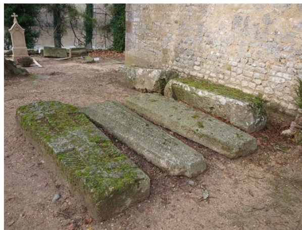
Sarcophages de Saint-Pierre-les-Eglises

Pour aller plus loin : visitez le musée archéologique et ne manquez pas l'église avec son chœur mérovingien et sa stèle chrétienne d'Aeternalis et de Servilla.